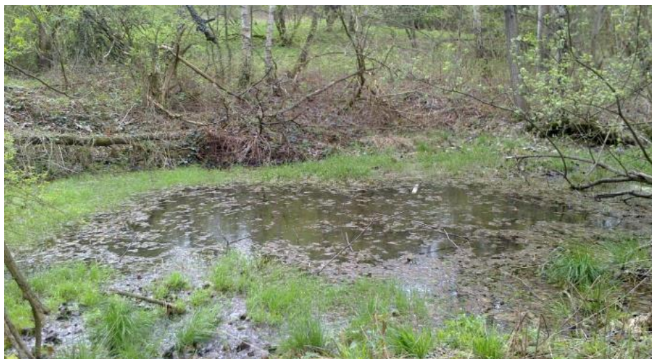
Fot. 1. Zastoisko wodne na koronie składowiska Phot. 1. Impounded water on the landfill crown

Z uwagi na niewłaściwe ukształtowanie bryły składowiska oraz brak uszczelnienia jego wierzchowiny nadmiar wód opadowych przelewając się przez koronę składowiska powoduje niszczenie skarp obwałowania kwatery (erozja wodna) oraz tworzenie się podłużnych wcięć (żłobin), które w istotny sposób przyczyniają się do utraty stateczności skarp (fot. 2).