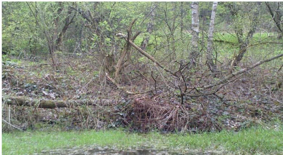
Fot. 3. Uschnięte drzewa w obrębie niecki składowiska Phot. 3. Dried-up trees in the area of landfills basin

Na składowisku przeprowadzono pomiar gazów detektorem „Duo Master”, który wykazał stężenie metanu przekraczające 20%. Wynika to najprawdopodobniej z wysokiej wilgotności złoża odpadów, co sprzyja procesowi metanogenezy. Namacalnym efektem emisji i migracji gazów \text{CH}_4 i \text{CO}_2 są usychające drzewa w obrębie niecki składowiska (fot. 3).