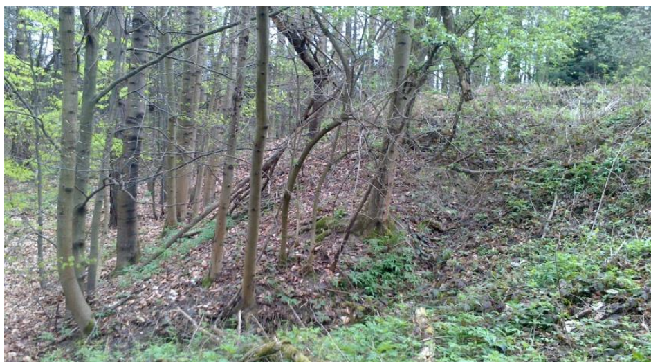
Fot. 2. Erozja wodna skarp obwałowania Phot. 2. Escarpments water erosion

Z uwagi na niewłaściwe ukształtowanie bryły składowiska oraz brak uszczelnienia jego wierzchowiny nadmiar wód opadowych przelewając się przez koronę składowiska powoduje niszczenie skarp obwałowania kwatery (erozja wodna) oraz tworzenie się podłużnych wcięć (żłobin), które w istotny sposób przyczyniają się do utraty stateczności skarp (fot. 2).