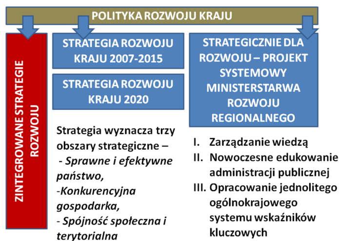
Rys. 2. Schemat układu dokumentów strategicznych w polityce rozwoju kraju Fig. 2. Scheme of strategic documents in the policy development of the country