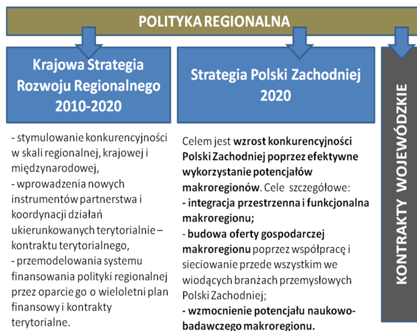
Rys. 4. Schemat układu dokumentów w polityce regionalnej na poziomie województwa lubuskiego