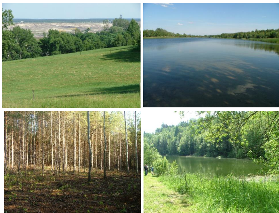
Fot. 3-6. Rekultywacja terenów po wydobyciu węgla brunatnego w głównych docelowych kierunkach zagospodarowania terenu; powyżej okręg koniński, poniżej Łęknica i Sieniawa – woj. lubuskie Phot. 3-6. Post-mining areas reclamation in the main directions of development of the target area; above the district of Konin, below Łęknica and Sieniawa - lubuskie province

przy tym estetycznie i ekologicznie powiązanego z otoczeniem. Oznacza to z grubsza, że możliwe są do realizacji zarówno kierunki produkcyjne: rolny i leśny, jak też nieprodukcyjne: wodny i specjalny. Ostatni z wymienionych jest często uszczegóławiany, z racji zróżnicowania obranej docelowej użyteczności. Wskazuje się m.in. kierunki: infrastrukturalny (infrastrukturalny), rekreacyjny, zieleni miejskiej, budownictwa powszechnego i budownictwa drogowego (budowlany). W toku prac inżynieryjno-technicznych w ramach rekultywacji terenów pokopalnianych wykonywane są różne działania, w zależności od założonych wstępnie efektów docelowych. Przyjmując różne technologie rekultywacji, uzyskuje się różny sposób, poziom oraz tempo zasiedlenia terenu przez gatunki roślin i zwierząt.