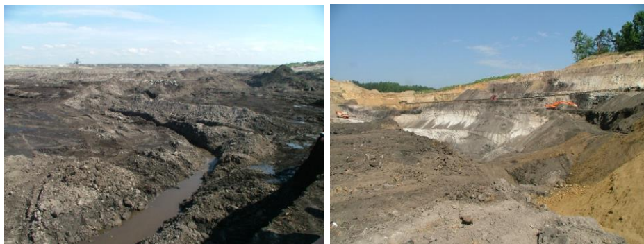
Fot. 1-2. Degradacja powierzchni ziemi w trakcie funkcjonowania kopalni odkrywkowej węgla brunatnego Phot. 1-2. The degradation of the earth's surface during the operation of lignite opencast mine

Dodatkowo, spalanie węgla brunatnego oznacza wysoka emisję CO 2 do powietrza atmosferycznego, liczoną na 101 kg CO 2 ·GJ -1 [Kasztelewicz 2007].