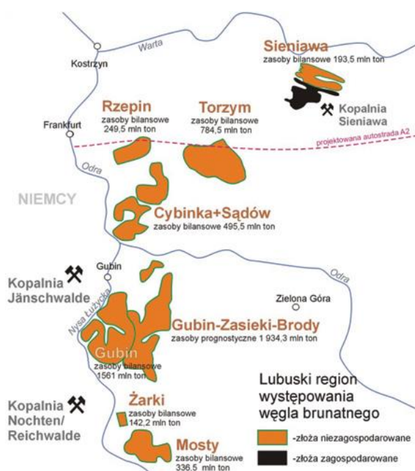
Rys. 2. Lokalizacja i zasoby bilansowe lubuskich złóż węgla brunatnego [oprac. Kasztelewicz 2011, na podst. Bednarczyk 2008, Bednarczyk i Nowak 2010]

zlokalizowane są w rejonie zachodnim (rys. 2) i legnickim, w których zasoby bilansowe szacowane są na [Kasiński i in. 2006]: Gubin-Brody 1934,3 mln Mg, Gubin 1050,8 mln Mg, Legnica Zachód 863,6 mln Mg, Legnica Wschód 839,3 mln Mg, Radomierzyce 503,7 mln Mg, Rzepin 249,5 mln Mg. W roku 2013 Polska zużyła 65,8 mln ton węgla brunatnego i 78,5 mln ton węgla kamiennego [GUS 2014]. Według Min. Gosp. [2009], zapotrzebowanie na węgiel brunatny do roku 2030 będzie się wahać w zakresie 45-57 mln ton rocznie. Przy niezmiennym względem obecnego zapotrzebowaniu na ten surowiec jego zasoby starczą na prawie 350 lat [PPEP 2014].