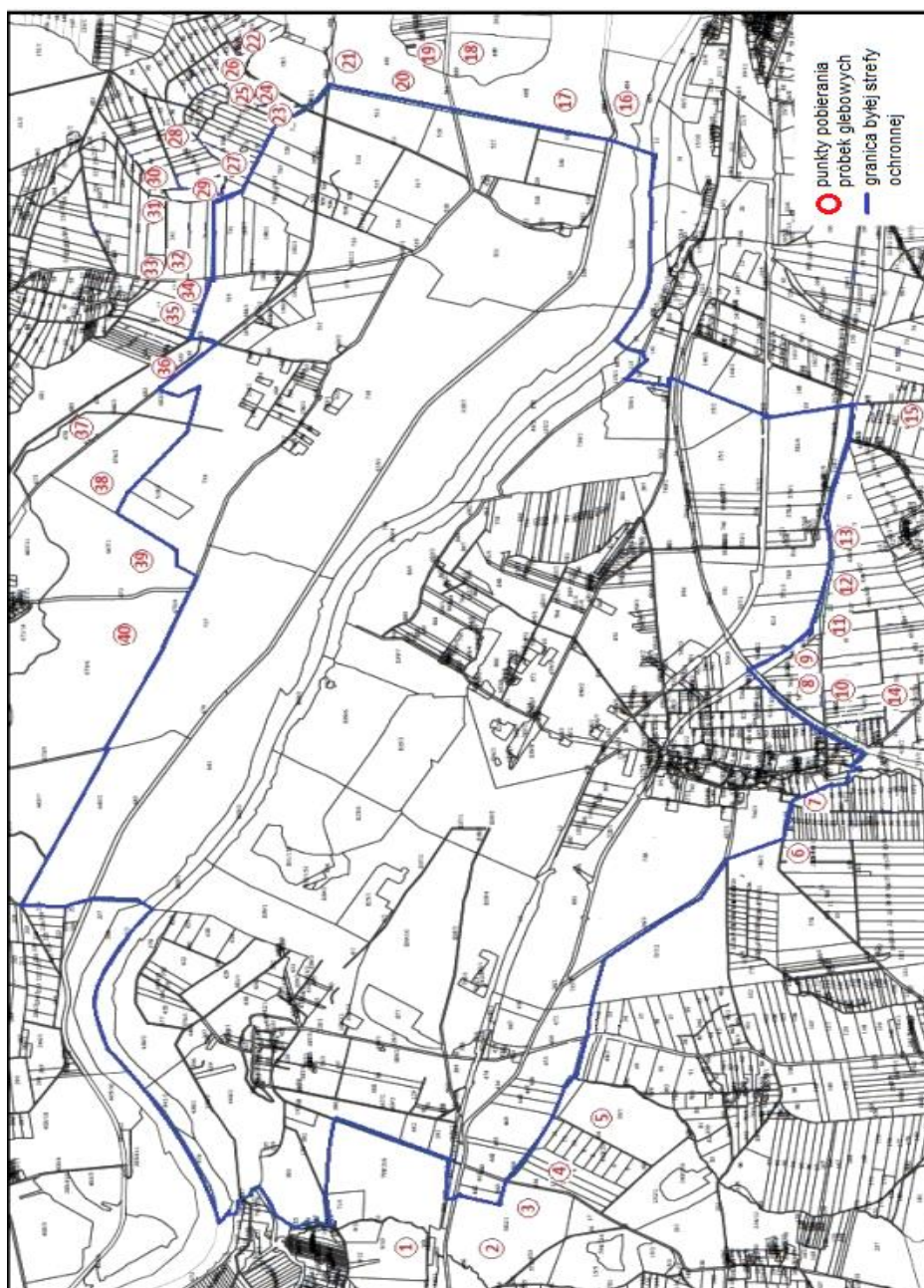
Rys. 1. Mapa lokalizacji poboru próbek glebowych z rejonu Huty Miedzi GŁOGÓW