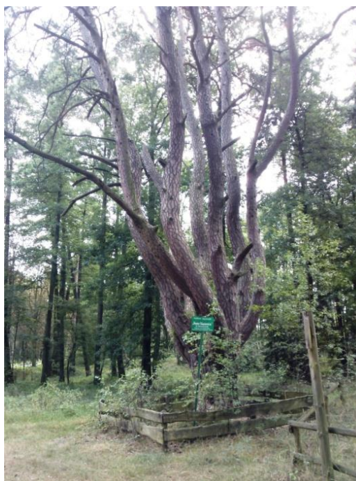
Fot. 1. Pomnik przyrody w gminie Brody o nazwie „Ośmiornica” Photo 1. Natural monument in the municipality of Brody called "Octopus"